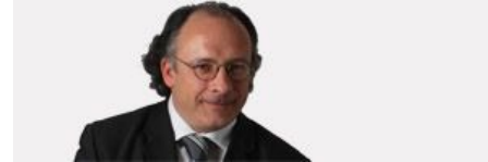
L'éditorial d'Yves Thérard