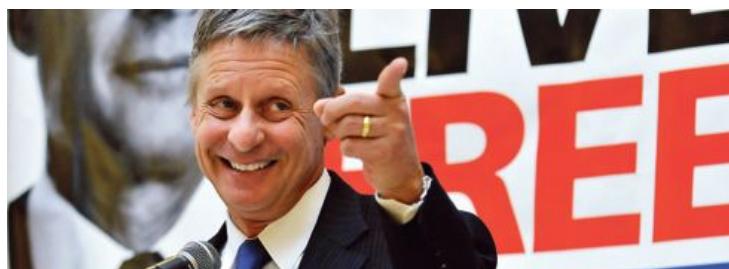
PORTRAIT - Troisième homme généralement ignoré de la présidentielle