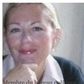
Membre du bureau politique de l'Alliance royale et déléguée d'Alsace-Lorraine.