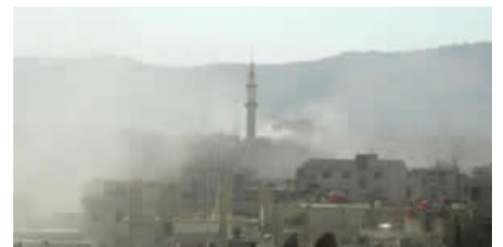
La vérité sur les armes chimiques en Syrie