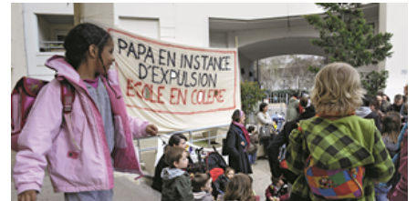
Regroupement familial : la grande hypocrisie