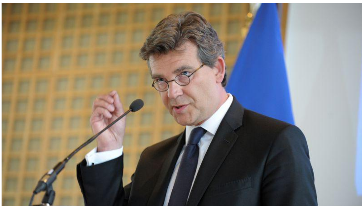
Arnaud Montebourg, le 25 août, à Bercy.

FIGAROVOX/TRIBUNE - Pour Christian Combaz, lors de son allocution télévisée, l'avocat Arnaud Montebourg a administré une véritable leçon de français au Premier ministre et au Président de la République.