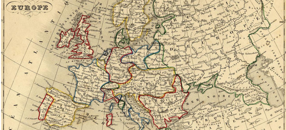
Carte de l'Europe - 1843.

Vox Politique (http://premium.lefigaro.fr/vox/politique/) | Par Philippe Bénéton (#figp-author)